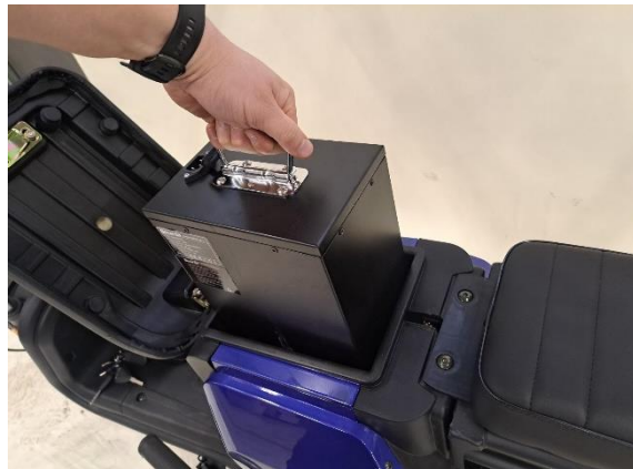
Nosta akku pois.