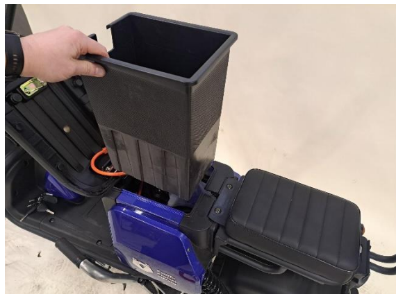
Nosta akkulaatikko pois.

Uuden osan asennus käänteisessä järjestyksessä.