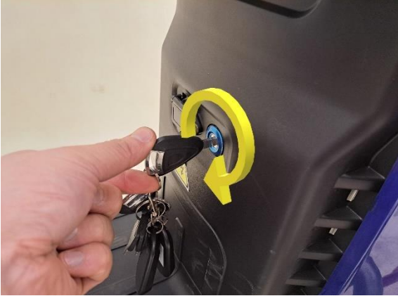
Avaa penkin lukitus.